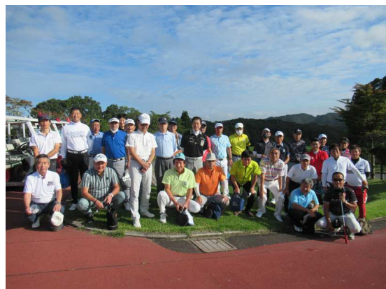
ゴルフクラブ（令和3年度）