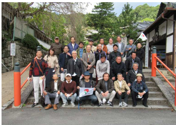
史跡めぐり（令和3年度）